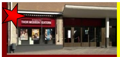
Thor Modén Teatern i Kungsör